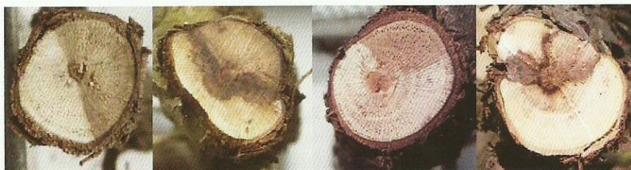
Slika 1. Simptomi botriosferijskoga sušenja na presjecima krakova vinove loze

Iz navedene skupine visoke patogenosti, Kaliterna i sur. (2013) na vinovoj lozi pronašli su vrstu Neofusicoccum parvum (Pennycook & Samuels) Crous, Slippers & Phillips, što je ujedno i njezin prvi nalaz u Hrvatskoj do sada.